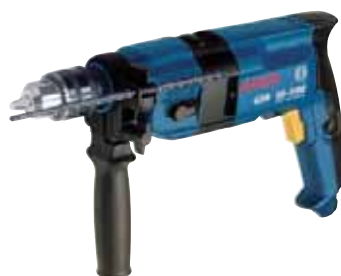
060 1194 577 GSB 20-2 RE