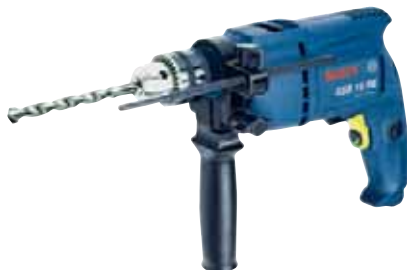
060 1247 617 GSB 16 RE