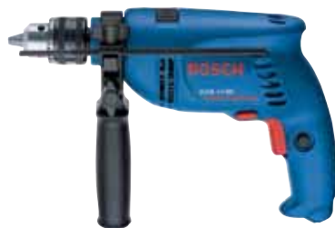
060 113C 517 GSB 13-2 RE