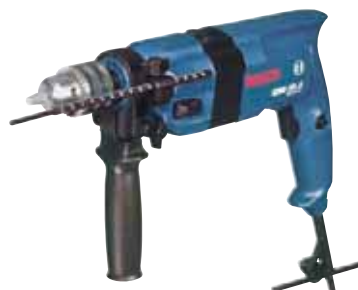
060 1184 177 GSB 20-2